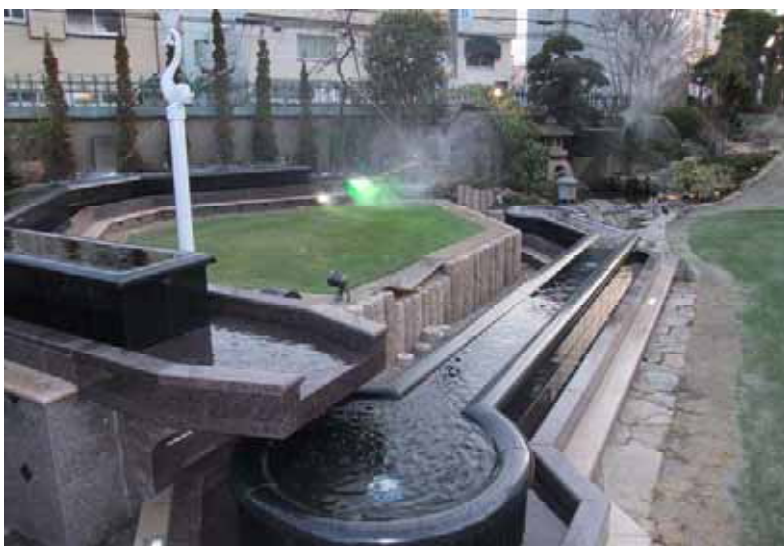
光と霧と水のスペクタクル。夜はさらにきれいです。

・コンクリートの表面に特注の御影石を貼り、 すっかりコンクリートの表面は姿を消しましたが、 精度に対しお褒めの言葉をいただきました。 製品は全て新型枠で製造しました。