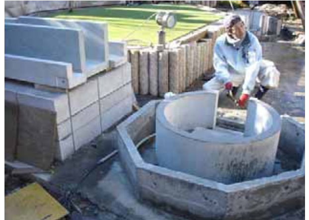
内側円筒はプレキャスト、外側は現場打ちです。