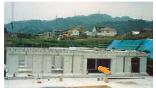
▲ 駐輪場内通路部参考写真