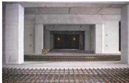
▲ 駐輪場内通路部参考写真